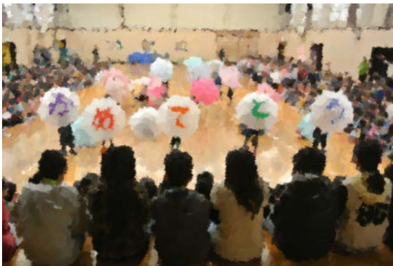
*2年生からは替え歌とダンスの贈り物*