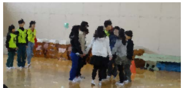
*体育委員がカバディの遊び方を紹介しました*

学校保健委員会の活動として、4・5・6年生の児童を対象に、「外で遊んで、体力アップ!」というテーマのもと、体力作りに対する関心を高めました。今年度の新体力テストの結果から、持久力や投力に課題を抱えていることがわかりました。また、児童のアンケート結果から、8割の児童は外遊びが好きだが、実際に外で遊んでいる児童は3割しかいないという実態が浮かび上がりました。外に行かない理由の中には、楽しい遊びがないなどの意見が含まれていました。そこで、課題の力が伸ばせて、児童が興味を抱きそうな遊びをいくつか紹介しました。学校保健委員会後、さっそく声を掛け合って、ろくむしやカバディなどで遊んでいる姿が見られました。これをきっかけに、外で遊ぶ児童が増え、体力向上の一助となることを期待しています。(担当:宮岡)