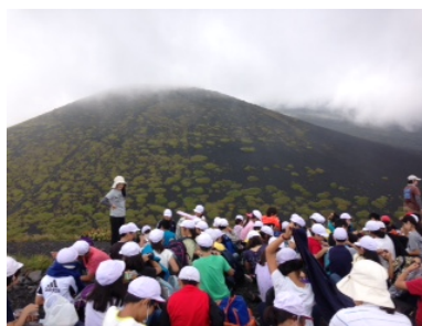
「ふじさんぼ」(兄山をバックに)「寒沢の源流を訪ねよう」